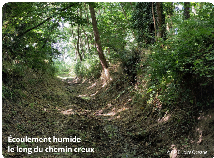
Écoulement humide le long du chemin creux

Cependant, il s'agit bien ici d'un écoulement naturel, car de l'eau s'y écoule depuis une source une grande partie de l'année. Ce n'est donc pas non plus un simple fossé, dont le lit est creusé par l'Homme à des fins hydrauliques et qui ne comporte pas de source naturelle.