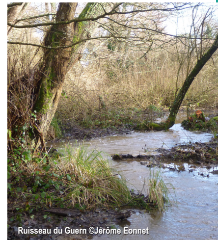
Ruisseau du Guern

L'amélioration du bon état des cours d'eau ainsi que des bords de Vilaine est une priorité.