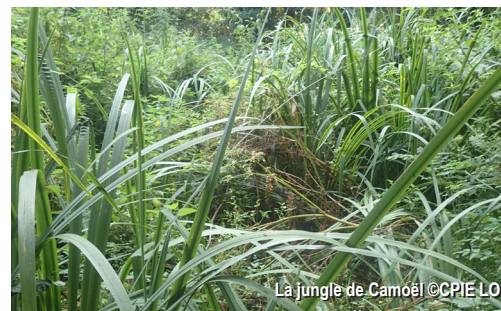
La jungle de Camoël

Une partie du sentier en sous-bois est très humide en hiver : prévoir des bottes !