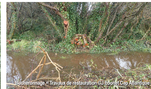
Bucheronnage = Travaux de restauration